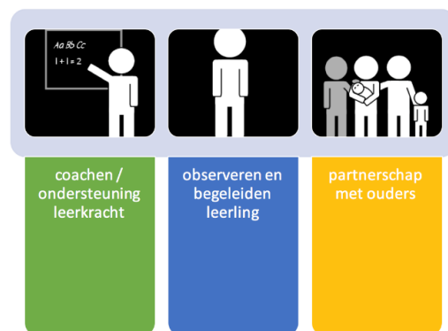
figuur 2: 3 pijlers